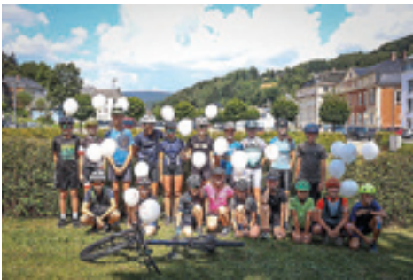
Die VSC-Sportler nahmen am Dienstag an einem Kinder-Hospiz-Radrennen teil.

Konstanze Schneider Pressesprecherin VSC